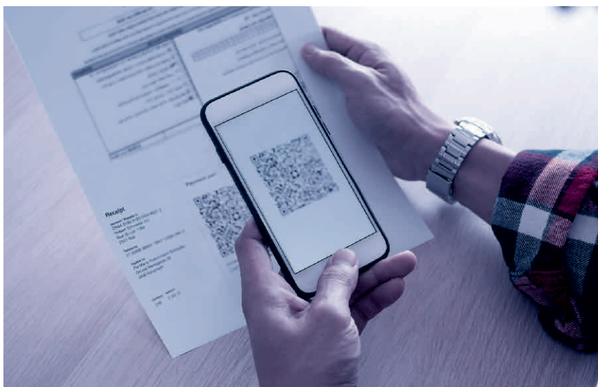
Scannen und fertig: Der QR-Code enthält alle relevanten Rechnungsdaten.

Lesen Sie mehr zum Thema im Blogbeitrag von TREUHAND|SUISSE unter www.treuhandswiss.ch/blog